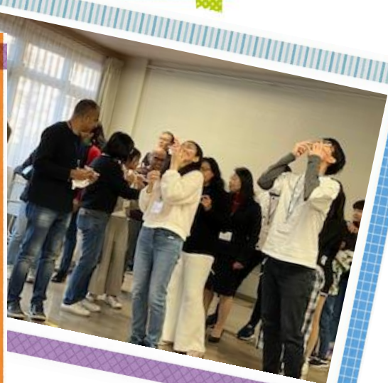
2023年 交流会 社会見学より