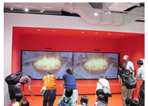
↑しょうかきのつかいかた↑